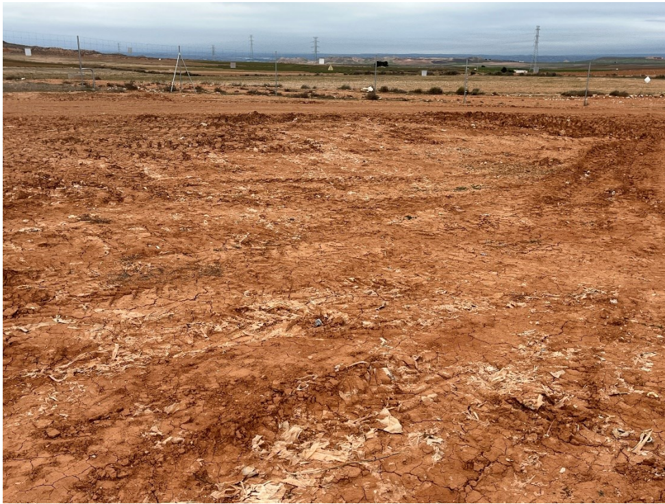
Figura 7 Restos de plásticos