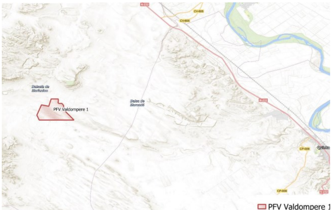
Figura 1 Localización del proyecto

Se localiza a 7 km al sureste de esta localidad sobre parcelas dedicadas al cultivo de cereal de secano en extensivo. El paraje donde se ubica la planta (Figura 1) se denomina "Valdecara" y se encuentra a 350 msnm aproximadamente.