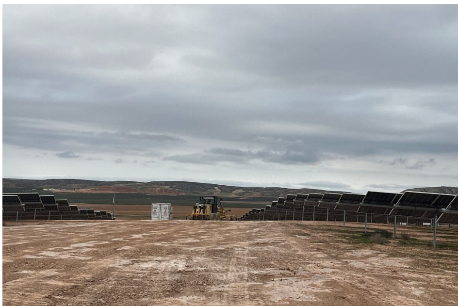
Figura 5 Trabajo de nivelación del terreno

El presente anexo se compone de un número representativo de fotografías del total realizado durante el periodo evaluado, escogidas por su relevancia y/o carácter explicativo para la correcta comprensión del presente informe.