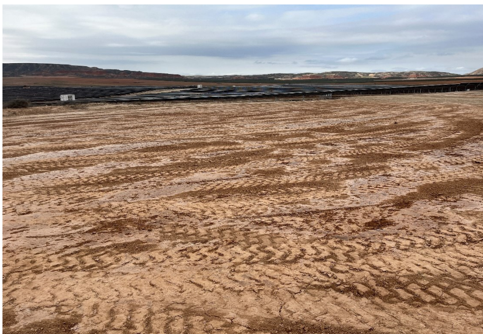
Figura 6 Trabajo de nivelación del terreno