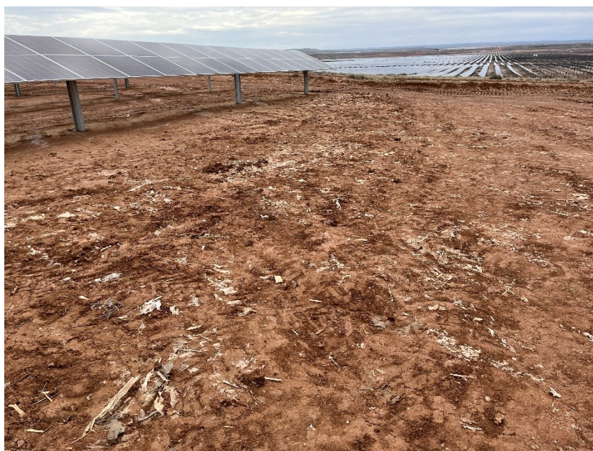
Figura 3 Restos de plásticos

Durante las últimas visitas se han observado abundantes trozos de plástico procedentes de el embalaje de las cajas de los módulos fotovoltaicos.