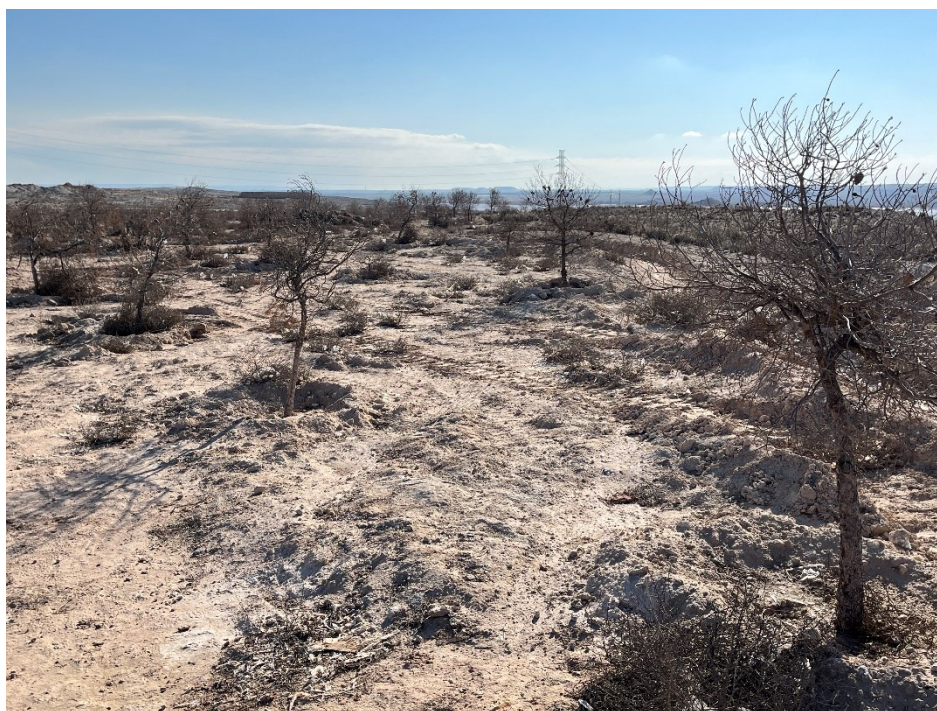
Figura 2 Masa de pinar trasplantada

Se ha continuado con el seguimiento de la evolución de la masa de pinar trasplantada durante los meses de Marzo y Abril, siendo esta muy negativa, con un índice de supervivencia del 0%.